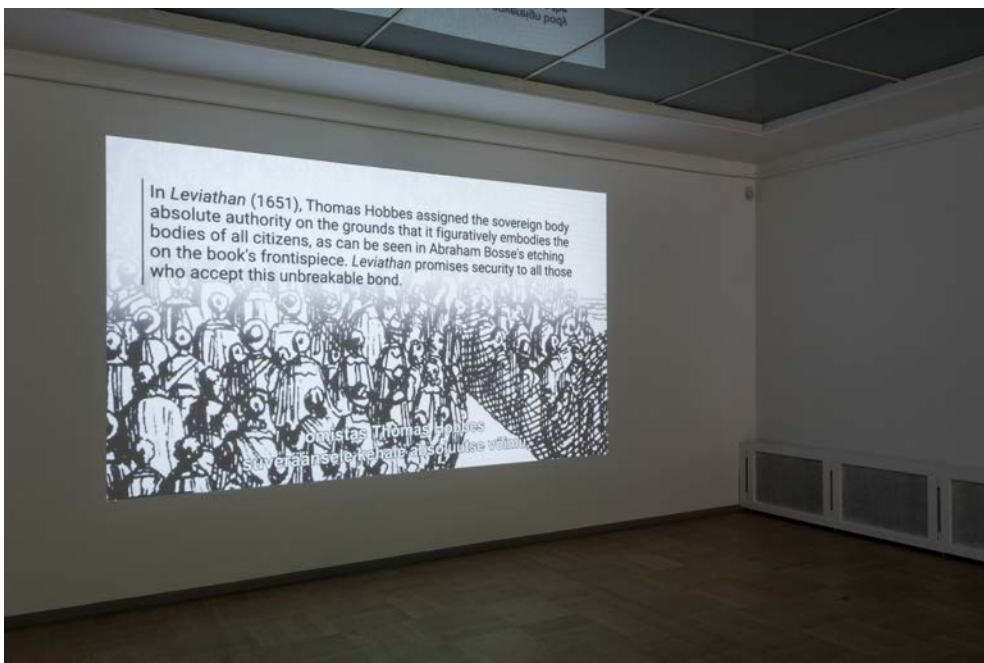
"Not Sinking, Swarming". Installation view: "Barricading the Ice Sheets" (solo show), Tallinn Art Hall, 2022.

Im Zuge der Diskussion erfährt man, dass das Netzwerk in Komitees (Arbeitsgruppen) gegliedert ist, die jeweils spezielle Aufgaben übernehmen: Kommunikation, Training, Verpflegung, Logistik, Aktionsplanung, Strategie, Rechtshilfe, Dialog mit der Polizei, Forderungen, Care und Finanzen