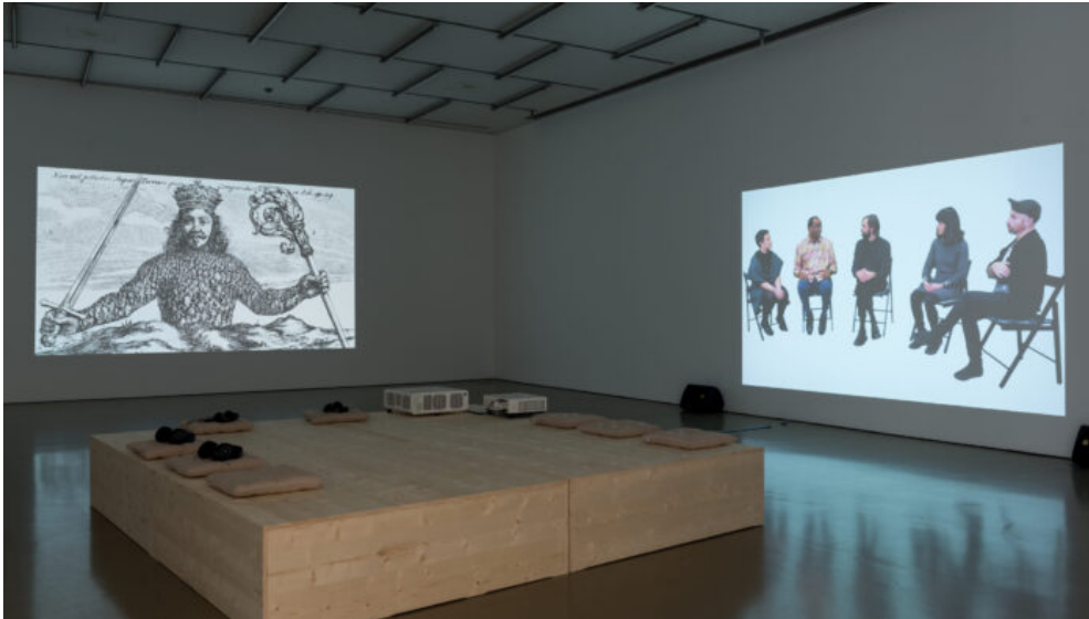
“Not Sinking, Swarming”. Installation view: “Barricading the Ice Sheets” (solo show), Camera Austria, Graz, 2021.

“Not Sinking, Swarming” includes footage from the civil disobedience of October 7, “Not Sinking, Swarming” (Nicht untergehen, ausschwärmen) enthält auch Material einer Aktion des zivilen Ungehorsams am 7. Oktober 2019, die bedeutendste der auf der Versammlung geplanten Aktionen. Hunderte Aktivist_innen blockierten als Teil einer internationalen Woche der Rebellion für Klimagerechtigkeit mit einem Boot eine Schnellstraßen-Überführung in der Nähe der Nuevos Ministerios von Madrid.