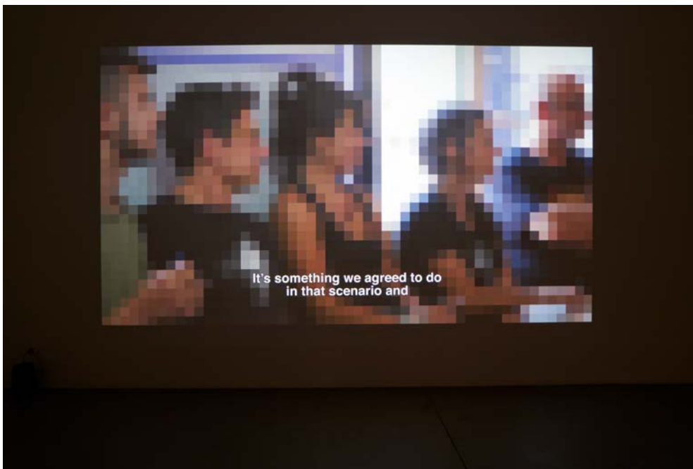
"Not Sinking, Swarming". Installation view: "Barricading the Ice Sheets" (solo show), Museum of Contemporary Art Zagreb, 2021.

Im Zuge der Diskussion erfährt man, dass das Netzwerk in Komitees (Arbeitsgruppen) gegliedert ist, die jeweils spezielle Aufgaben übernehmen: Kommunikation, Training, Verpflegung, Logistik, Aktionsplanung, Strategie, Rechtshilfe, Dialog mit der Polizei, Forderungen, Care und Finanzen