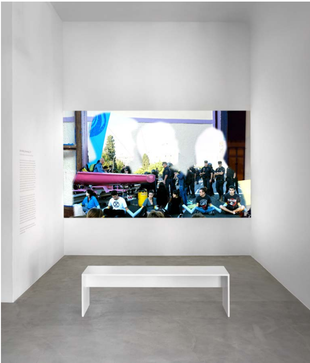
"Not Sinking, Swarming". Installation view: "Barricading the Ice Sheets" (solo show), Neuer Berliner Kunstverein, Berlin, 2022.