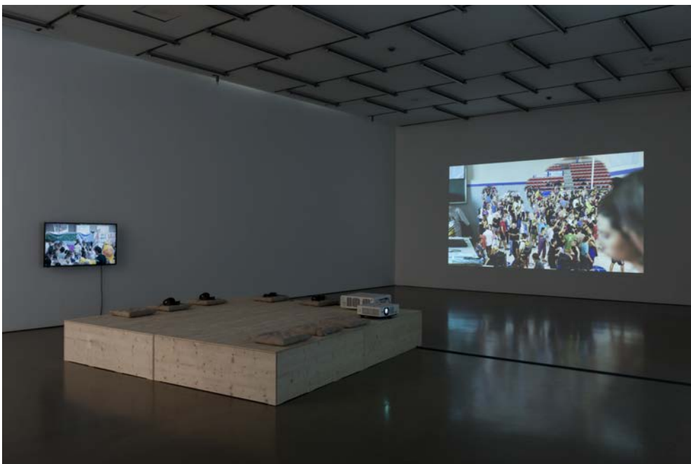
"Not Sinking, Swarming". Installation view: "Barricading the Ice Sheets" (solo show), Camera Austria, Graz, 2021.