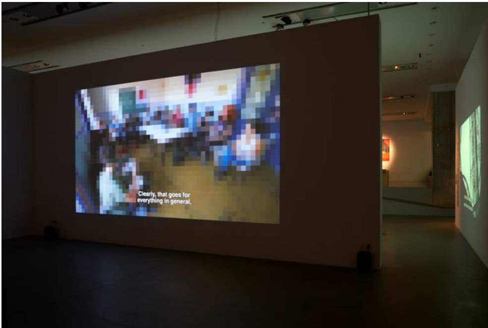
"Not Sinking, Swarming". Installation view: "Barricading the Ice Sheets" (solo show), Museum of Contemporary Art Zagreb, 2021.

Der Ausgangspunkt dieses Films ist eine vierstündige Versammlung in Madrid im Oktober 2019, zu der sich unterschiedliche Gruppen gefunden hatten, um eine Aktion des zivilen Ungehorsams vorzubereiten. Die Gruppen – Ecologistas en Acción, Alternativa Antimilitarista MOC, Legal Sol, Extinction Rebellion, Climacció, Fridays for Future und Greenpeace – sind Teil der Plattform By 2020 We Rise up , die in ganz Europa eine Klimarebellion anzufachen will.